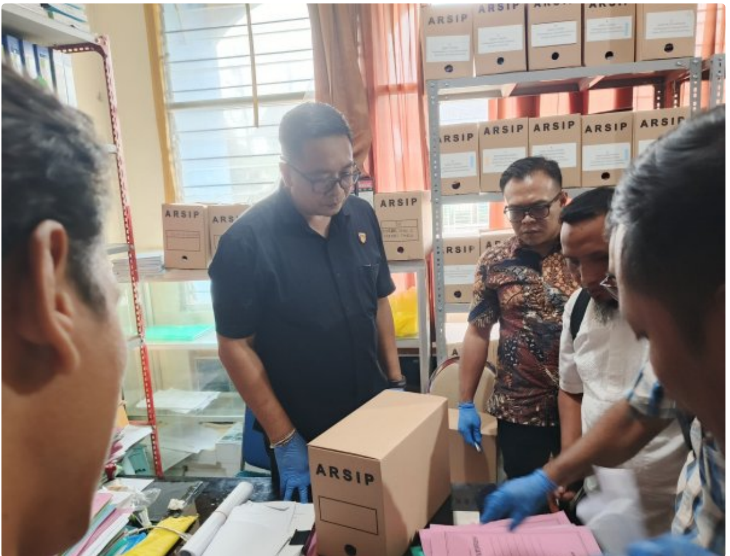
Saat Pengeledahan di Dikbud NTB, Jumat (13/12/2024)

MATARAM, NTB – Dugaan praktik pungutan liar (pungli) dalam proyek Dana Alokasi Khusus (DAK) tahun 2024 di SMK 3 Mataram terus diusut. Dalam pengembangan kasus ini, Tim Tindak Pidana Korupsi (Tipidkor) Polresta